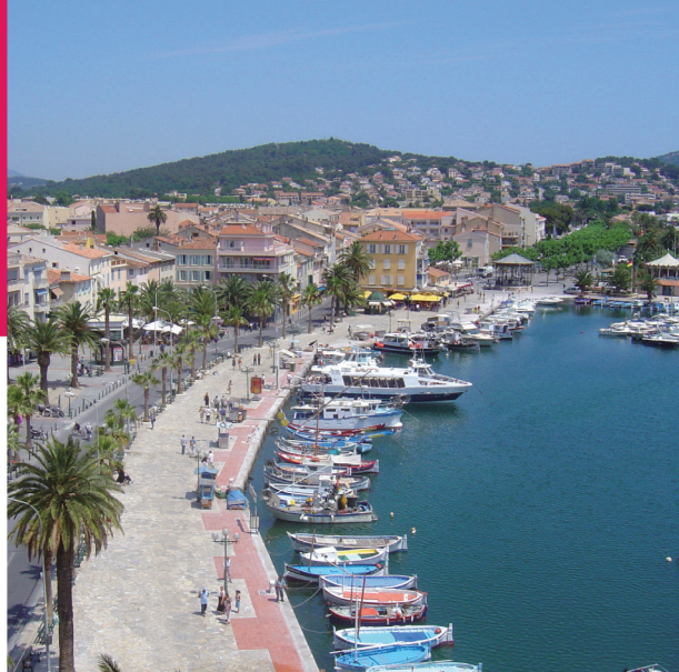
Vue du Port depuis la terrasse

La tour perd son rôle de défense, à partir du XVI ème siècle, et devient une prison et un grenier pour les provisions, mais reste armée de plusieurs canons.